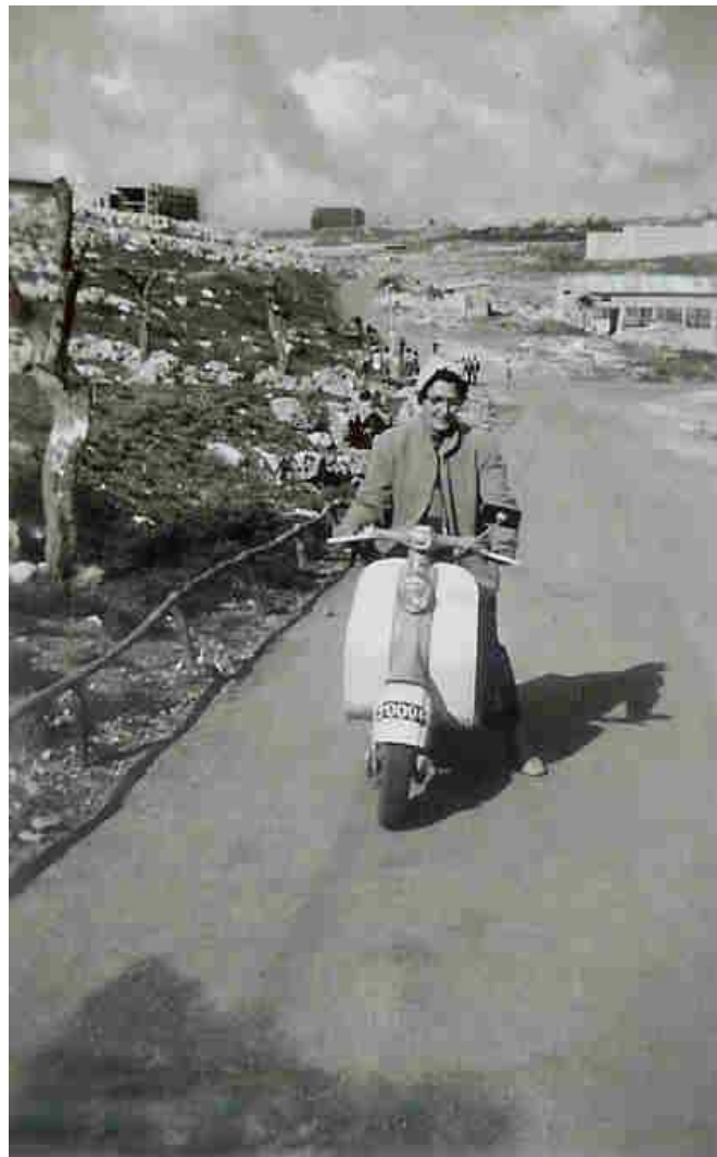
המורה שרכבה על הלמברטה במשך 13 שנים